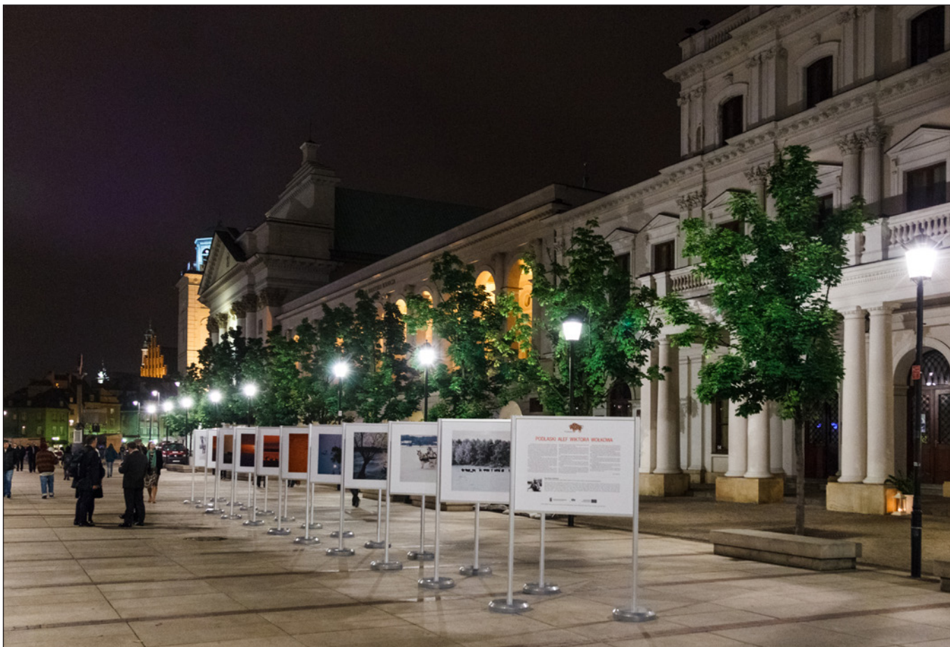
Wystawa fotografii Wiktora Wołkwa w ramach promocji województwa podlaskiego Warszawa, czerwiec 2014