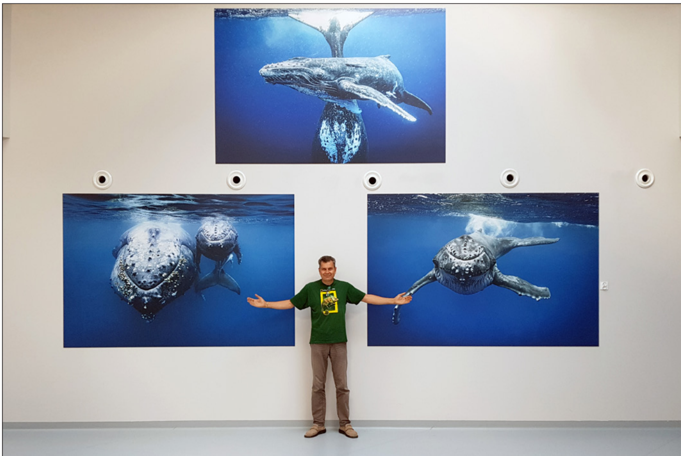
Fotografie humbaków autorstwa Sebastiana Gorgola Niepubliczna Szkoła Podstawowa im. Ferdynanda Magellana, Piaseczno, wrzesień 2018