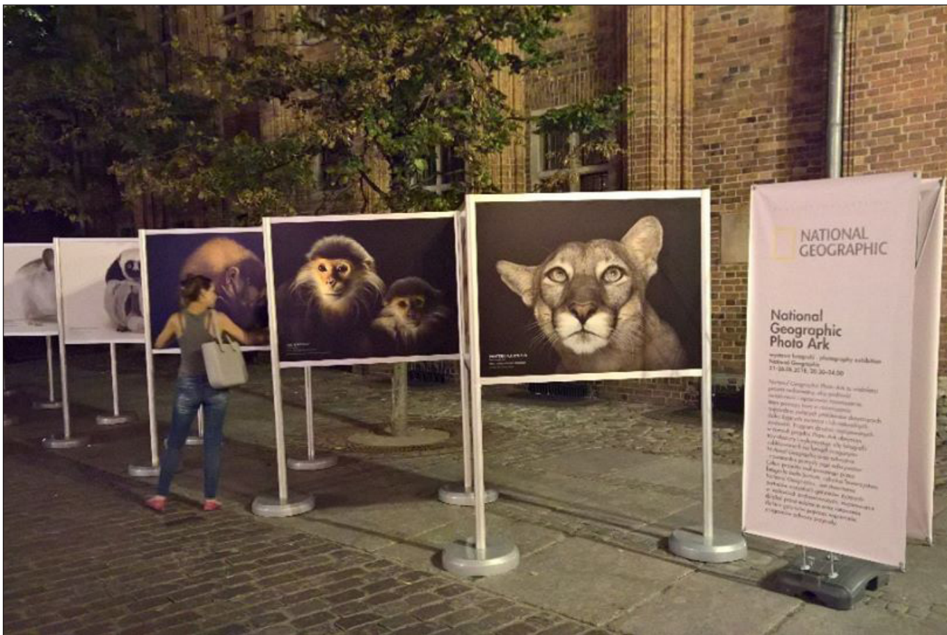
Wystawa fotografii National Geographic Photo Ark fot. Joel Sartore Starówka na Starym Mieście w Toruniu, sierpień 2018