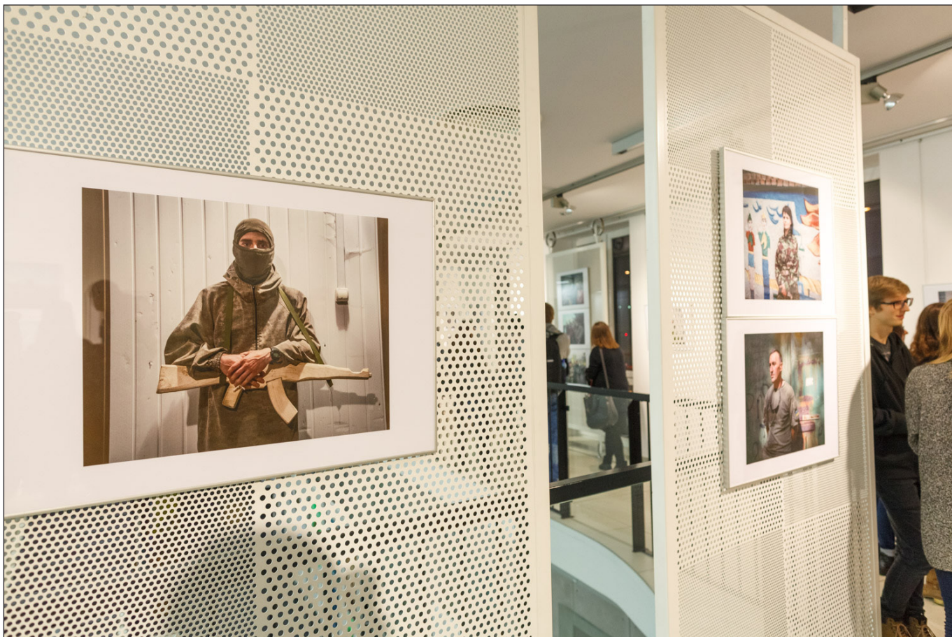
Wystawa fotografii Justyny Mielnikiewicz - „ A Ukraine runs through it ” Białystok, grudzień 2015