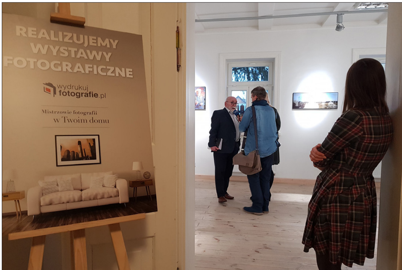
Wystawa fotografii Piotra Sawickiego „ Subiektywnie ” Galeria im. Słędzińskich w Białymstoku, luty 2020