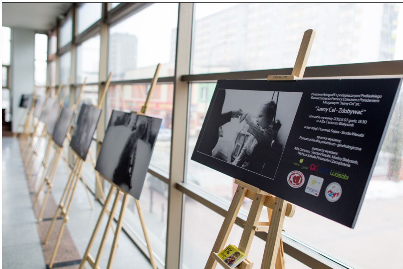
Wystawa fotografii z podopiecznymi Podlaskiego Stowarzyszenia Pomocy Dzieciom z Porażeniem Mózgowym „Jasny Cel” pt.: „Jasny Cel - Zdobywać” , 2012