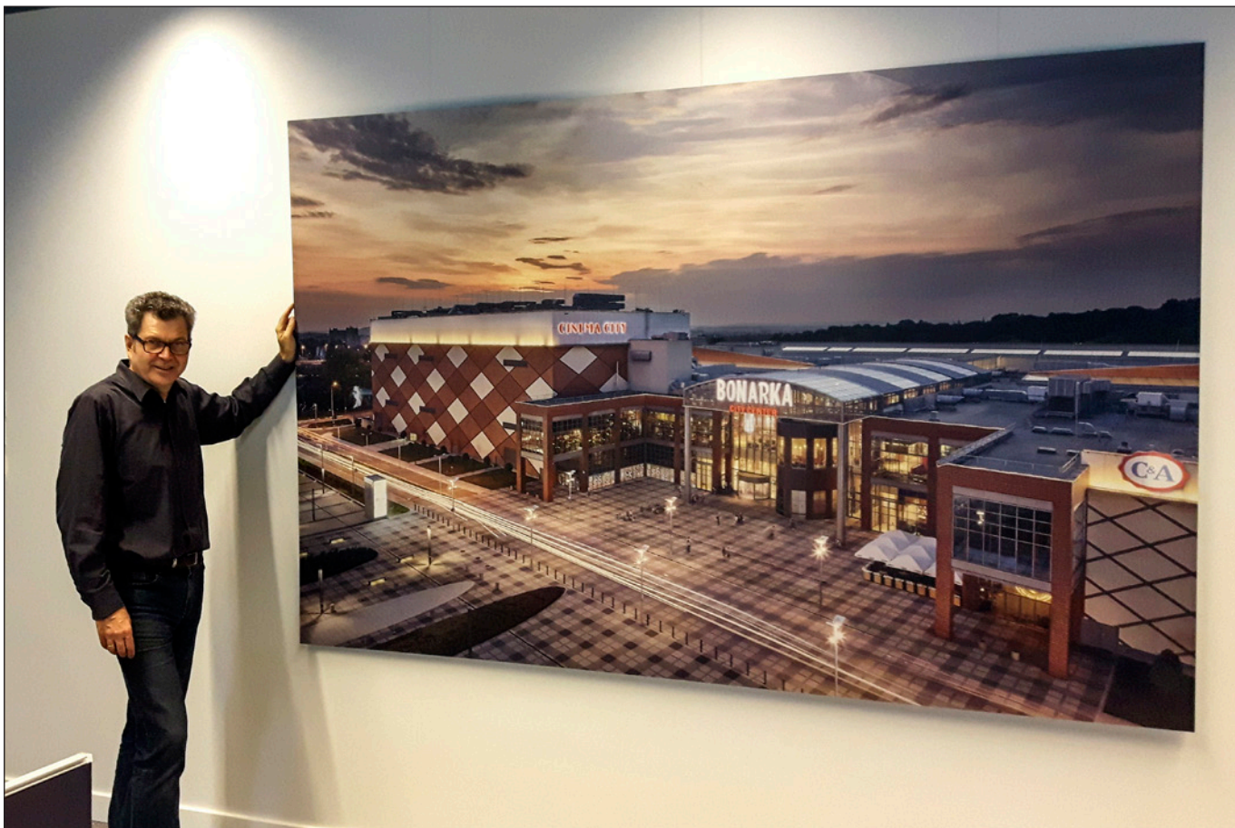
Wystrój biura, Biurowiec Cosmopolitan , autor fotografii Rafał Nebelski Warszawa, październik 2017