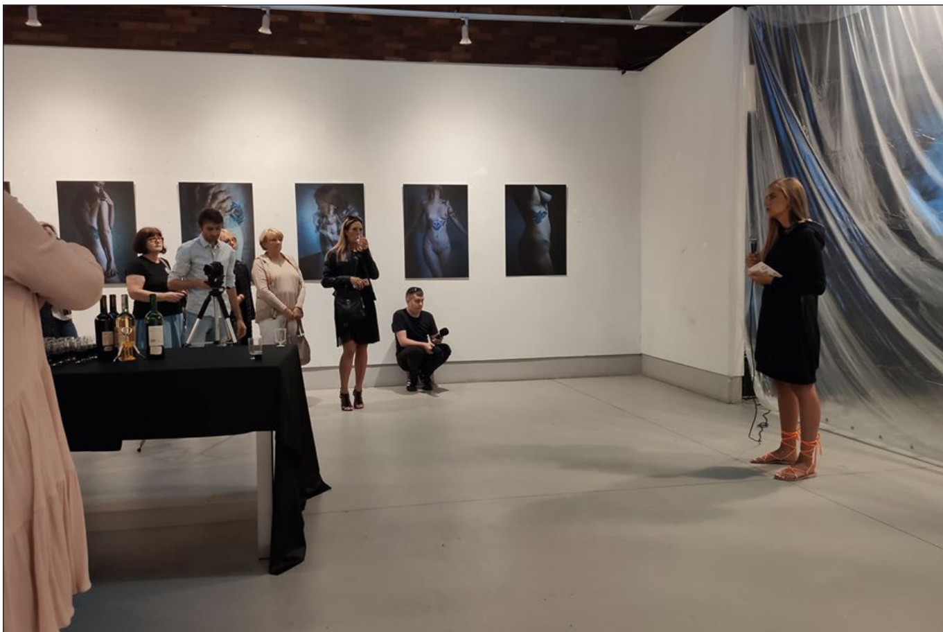
Fot. Joanna Walasek, „ Oczy szeroko zamknięte ” Regionalne Towarzystwo Zachęty Sztuk Pięknych w Częstochowie, wrzesień 2019