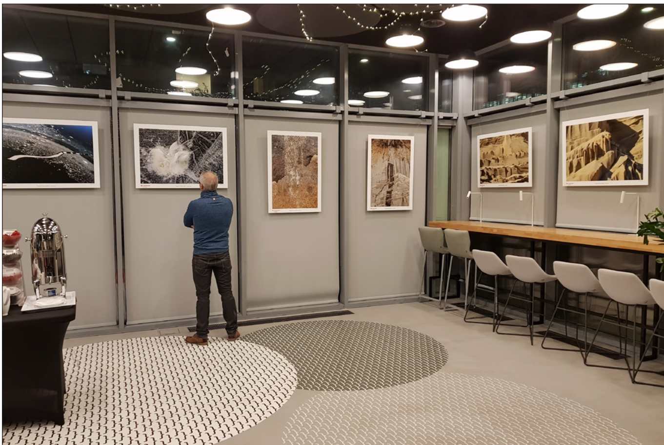
Wystawa Tryptyk Warmiński „ Warmia pokazana w sposób nieoczywisty ” Centrum relacyjne w siedzibie głównej Santander Bank Polska w Warszawie, listopad 2018