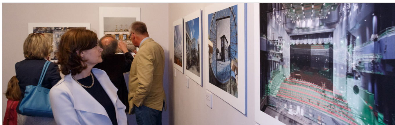
Wystawa fotografii Piotra Sawickiego „ Teatr czasu ” Kraków, kwiecień 2016